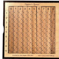
Gambar 1. Tabel napier

didik untuk mengingat perkalian angka 1 hingga 9.