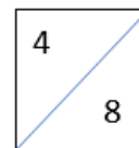
Gambar 2. Contoh perkalian napier

Apabila peserta didik telah menguasai hafalan perkalian tersebut, mereka dapat langsung menerapkan metode perhitungan sesuai dengan prosedur yang berlaku dalam perkalian napier . Batang Napier mirip dengan tabel perkalian yang dituliskan dengan cara berbeda, Misalkan untuk 8 \times 6 = 48 , Pada Batang Napier, hasil 8 \times 6 = 48 yang dituliskan dengan: