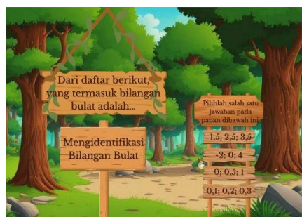
Gambar 6. Tampilan Latihan Soal