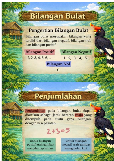
Gambar 5. Tampilan Materi