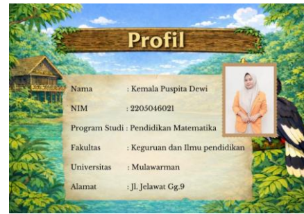
Gambar 8. Tampilan Profil Pengembang

Media pembelajaran Scratch kemudian divalidasi oleh dua ahli materi (satu dosen Program Studi Pendidikan Matematika Universitas Mulawarman dan satu guru matematika kelas VII SMP Negeri 48 Samarinda) dan satu ahli media (dosen Program Studi Pendidikan Matematika Universitas Mulawarman). Hasil validasi disajikan pada Tabel 4 dan 5.