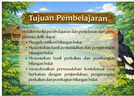
Gambar 4. Tampilan Tujuan Pembelajaran