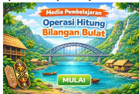
Gambar 1. Tampilan Awal

Tahap pengembangan ini mencakup tiga bagian, yaitu pembuatan produk, uji validasi ahli materi, dan uji validasi ahli media. Pada tahap pembuatan produk, peneliti melalui beberapa tahap seperti pembuatan desain gambar sampul, pembuatan petunjuk penggunaan, pembuatan tujuan pembelajaran, pembuatan materi ajar, pembuatan latihan soal, pembuatan game , dan pembuatan profil pengembang. Berikut adalah tampilan-tampilan media pembelajaran.