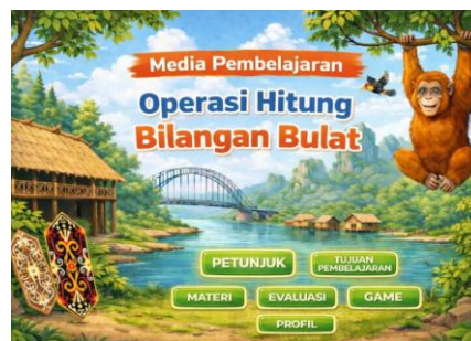
Gambar 2. Tampilan Menu Utama