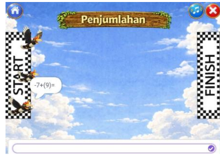
Gambar 7. Tampilan Game