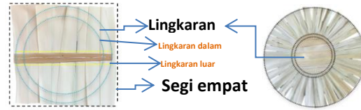
Gambar 1.2 Sesapah dan Bebaduk

Bangun datar seperti segi empat dan lingkaran muncul sebagai bentuk dominan pada bagian-bagian utama tembolak, khususnya pada sesapah dan bebaduk. Keberadaan dua lingkaran konsentris pada bagian tengah sesapah menunjukkan adanya pemahaman geometris mengenai pusat, jari-jari, dan hubungan antarlingkaran. Lingkaran dalam berfungsi sebagai batas struktural, sedangkan lingkaran luar menjadi penentu ukuran keseluruhan bidang. Hal ini menunjukkan bahwa objek matematika dalam tembolak tidak hadir secara acak, tetapi memiliki peran fungsional yang terintegrasi dengan kebutuhan struktural kerajinan (Sape & Syamsuddin, 2025).