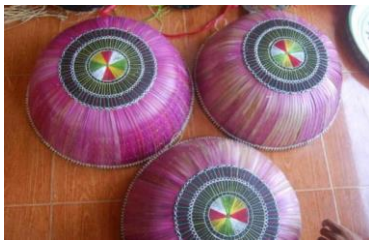
Gambar 1.1 Tembolak

Adapun contoh dari tembolak yang sering kita gunakan dalam kehidupan sehari-hari, sebagai berikut :