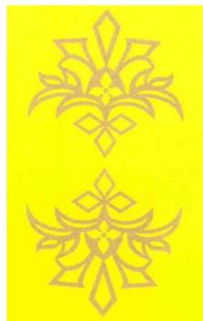
Gambar 1. Motif Pucuk Bersusun

Sejalan dengan hal tersebut, penalaran memiliki kendala yang dapat terlihat pada materi transformasi geometri. Siswa sering mengalami miskonsepsi dalam menentukan rotasi, refleksi, dan dilatasi (Ardinata et al., 2020). Kesulitan ini diperparah oleh minimnya pengaitan konsep matematika dengan realitas siswa, khususnya di Provinsi Riau. Konteks budaya lokal, khususnya budaya Melayu Riau, kaya akan konsep matematika, seperti pola simetri, transformasi, dan keteraturan geometris pada motif batik dan ornamen tradisional. Budaya Melayu tidak hanya mencakup nilai estetika dan filosofis, tetapi juga menunjukkan pola-pola matematis yang bisa dieksplorasi dalam pembelajaran. Oleh karenanya, budaya Melayu memiliki potensi besar untuk menjadi sumber konteks etnomatematika yang relevan dan autentik bagi siswa. Contoh konkret terdapat unsur geometri ada pada motif Pucuk Bersusun. Berikut gambar motif Pucuk Bersusun beserta etnomatematika yang berkaitan dengan konsep refleksi pada motif tersebut, perhatikan gambar 1 dan gambar 2.